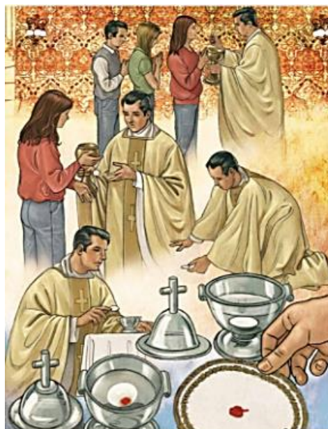
Tegning af det eukaristiske mirakel i Legnica. Fra: www.miracolieucharistici.org , Legnica

der være en naturlig forklaring i form af, at noget udefra som f.eks. svamp eller bakterier havde fremkaldt ændringen. Men det udelukkede det retsmedicinske institut i Wrocław. Vævsundersøgelsen viste, at vævet i den røde plet stammede fra hjertemusklen.