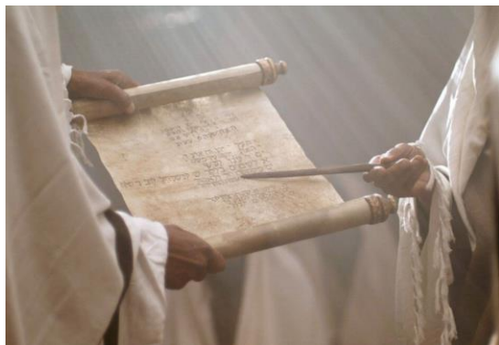
Læsning fra skriftrullen i synagogen

Tre af de fire evangelier i Ny Testamente fortæller om den hellige Josef i forbindelse med Jesu undfangelse, fødsel og barndom, men de bringer også en tankevækkende beretning, hvor den hellige Josef ikke selv er til stede. Egentlig siger beretningen rigtig meget om ham, og om hvordan han løste den opgave, Gud kaldte ham til, med at være far for Jesus. Det er beretningen om dengang, da Jesus læste op af skriftrullen og underviste i synagogen i sin hjemby, Nazaret.