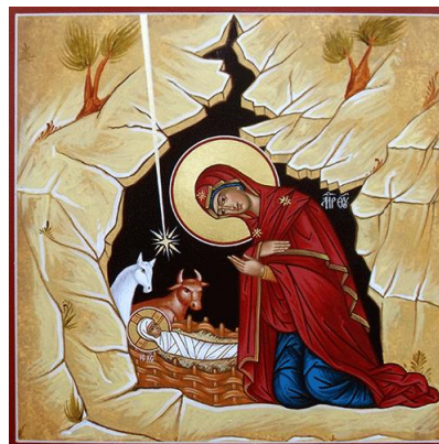
Kristus er duggen fra himlen, sendt for at læske vor tørre jord

Hvorfor bør man egentlig længes efter Gud? Han er jo alle vegne. Også hos mig her og nu, selvom jeg ikke skænker Ham nogen som helst form for opmærksomhed.