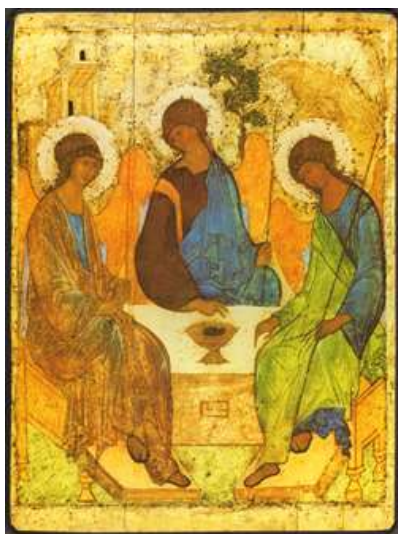
Rublev: Treenighedsikonen. De tre engle, der besøgte Abraham. Til venstre: Faderen, i midten Sønnen og til højre: Helligånden.

"Den Gammeltestamentlige Treenighed" forsøger ikke at afbilde Gud selv, men bruger på symbolsk måde fortællingen om Abrahams gæstebud (1. Mos, 18, 1-15), hvor Herren viser sig for Abraham og Sara i skikkelse af tre engle. Den kendteste af disse ikoner er malet af Andrej Rublev ca. 1411.