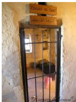
P. Charbels celle

I 1851 forlod han familiens landsby, 23 år gammel, for at tilbringe sine første klosterår i Annaya. Han kom ind i Den Maronitiske Orden og fik navnet Charbel, som stammer fra en martyr fra kirken i Antiokia i det andet århundrede. Den 1. november 1853 aflagde han sine evige løfter i Skt. Maron kloster - Annaya. Han blev ordineret til præst i Bkerky det maronitiske patriarkat, den 23 juli 1859.