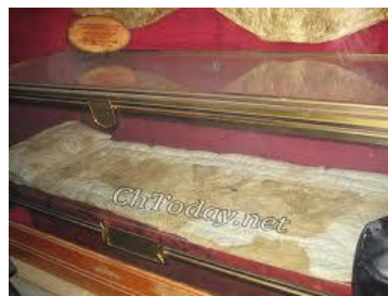
Skt. Charbels kiste med aftegninger af blod og sved.

Et par måneder efter p. Charbels død blev blændende lys set omkring hans grav. Man fandt, at der blev udskilt sved og blod fra hans lig, og derfor blev det overført til en særlig kiste.